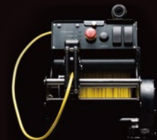
310mテザーケーブル +電動オートリール +電源供給バッテリーシステム