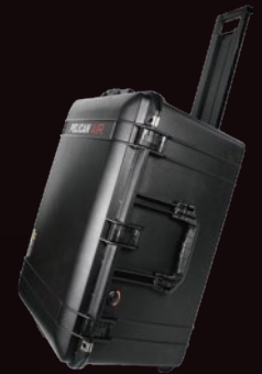
専用ハード ケース×2