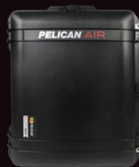
専用ハードケース×2