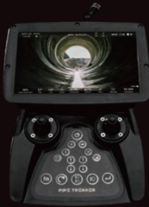
7インチLCD ハンドコントローラー