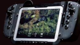
タッチスクリーン コントローラー (簡易レポート機能付き)