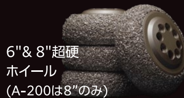
6" & 8"超硬 ホイール (A-200は8"のみ)