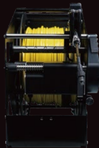
200mテザーケーブル +手動テザーリール